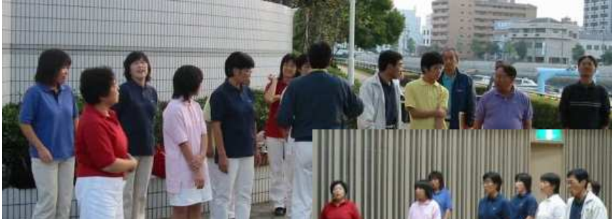
上 外に出て練習 右 リハーサル室で