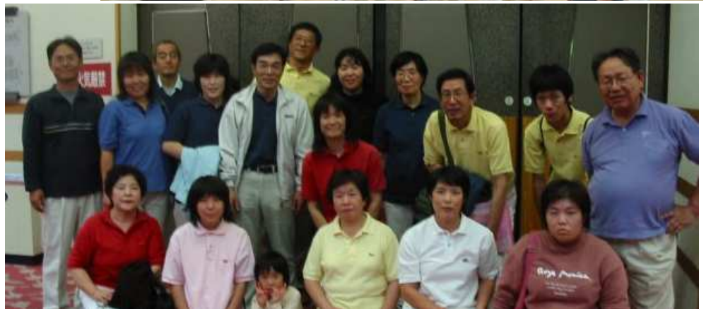
発表会が終わり、ほっとした

日本のうたごえ祭典初日の4日(金)、合唱発表会に出演。歌は「すばらしい約束」と「わたしたちの星」。いい記念になりました。